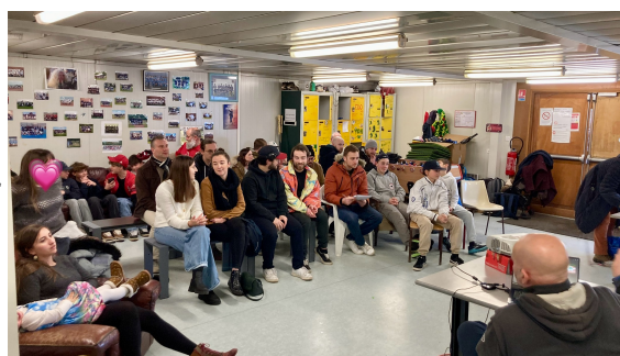
Assemblée Générale du 11.01.2025